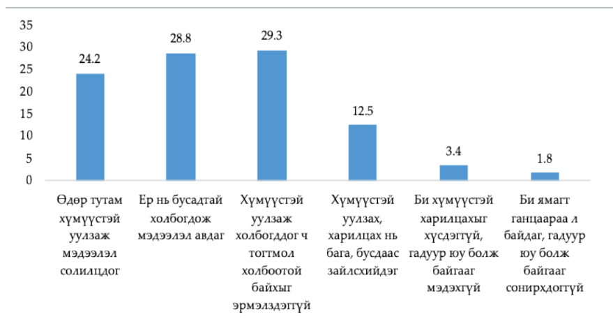
Зураг 3. Албан бус хөдөлмөр эрхлэгчдийн нийгмийн харилцаа, хувиар

Судалгаанд оролцсон хөдөлмөр эрхлэгчдийн цөөн хувь нь хүмүүстэй