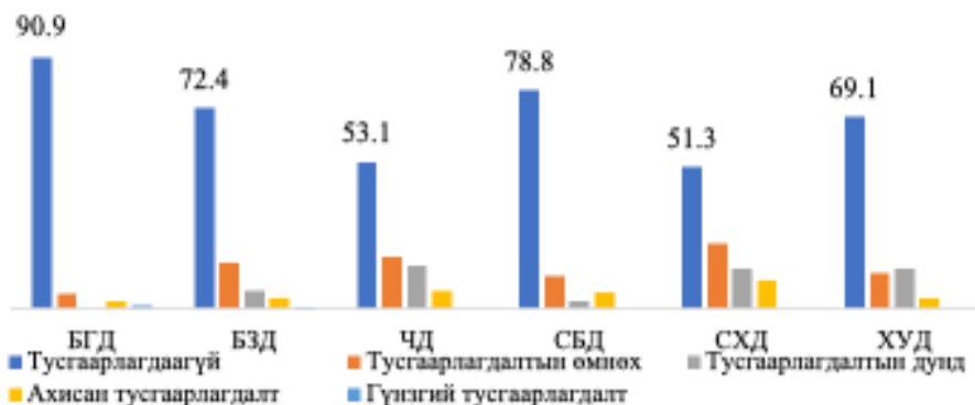
Зураг 1. Нийслэл хотын төвийн дүүргүүдийн тусгаарлагдмал байдлын түвшин (хувиар)

Тусгаарлагдмал байдлыг нийт 5 түвшнээр хуваан авч үзэв. Үүнд: Тусгаарлагдаагүй, тусгаарлагдалтын өмнөх, тусгаарлагдалтын дунд, ахисан тусгаарлагдалт, гүнзгий тусгаарлагдалт. Дүүргээр авч үзэхэд (хүн амын нягтралыг харгалзан зөвхөн төвийн 6