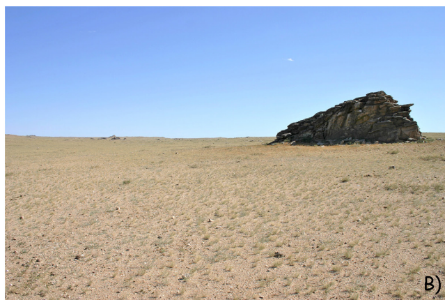
Зураг 1. А) Хадны зургийн дурсгалт газруудын байр зүйн зураг (Газрын зургийг үйлдсэн Д.Содномжамц) Б) Алаг-Өндөрийн хадны зургийн дурсгалын харагдах байдал В) Тахилгат Цагааны ар цохионы хадны зургийн дурсгалын харагдах байдал