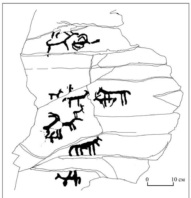
Зураг 2. Алаг Өндөрийн хадны зураг