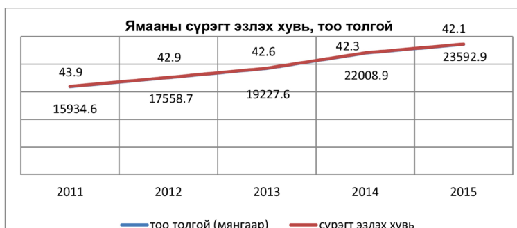
Зураг-2 Ямааны тоо толгой, сүрэгт эзлэх хувь, 2015 48