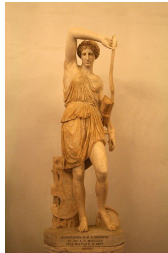
Зураг 3. “Шархадсан Амазон” уран баримал. Капитолийн музей, Итали, Ром хот

“Амазонкийн домог үлгэр” нь 3000-гаруй жилийн тэртээгээс яригдсаар өнөөдөртэй золгожээ. Амазонка гэдэг үг нь эртний Грекийн “ Хөхгүй ” гэдэг утгатай үг бөгөөд Амазонкчууд нь толгойдоо шовгор малгай шиг дуулгатай, баруун хөхгүй ( баруун хөхөө авахуулсан, тайруулсан, тасдуулсан ), зүүн хөх нь ил, бусад биеэ халхалсан тулааны зориулалт бүхий өмсгөлтэй, урт өргөн бүстэй, ороонго өвс мэт бамбайтай, исгэрч дуугардаг олс мэт зүйл гартаа барьж явдаг ЭМЭГТЭЙЧҮҮД байдаг ажээ.