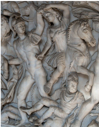
Зураг 2. Амазонкчууд хийгээд Грекчүүдийн тулалдаан. Уран баримал

Өөрөөр хэлбэл дэлхийн домог үлгэр ( myth )-ийн сэтгэлгээнд томоохон байр эзэлдэг Амазонкийн домог зүйн өгүүлэмжтэй холбон үзвэл уг бүтээлийн мөн чанар нь илүү тодорно гэсэн үг юм.