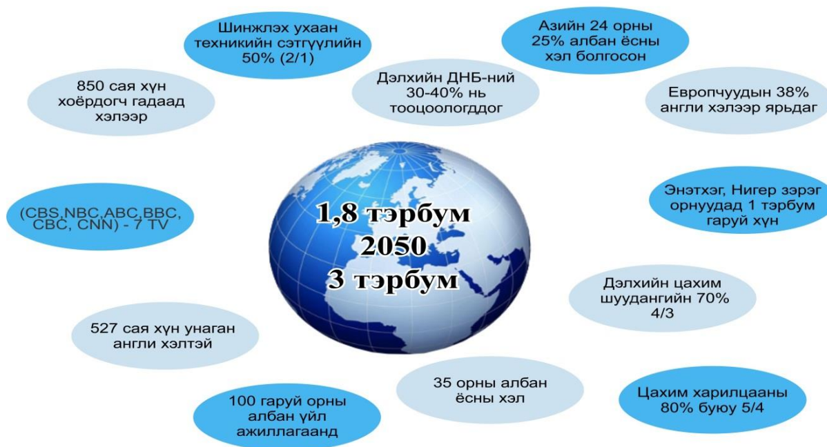
Зураг 1. Глобал англи хэлний хэрэглээ

Англи хэл шинжлэх ухааны салбарт 2012 онд дэлхийн хамгийн том мэдээллийн суурь бааз бүхий сэтгүүл “SCOPUS”-д мэдээлснээр 239 орны 21000 эрдэм шинжилгээ, судалгааны өгүүллийн 80% нь англи хэлээр бичигдсэн, шинжлэх ухаан техникийн сэтгүүлийн 50% англи хэлээр хэвлэгддэг, хэл шинжлэлийн салбарт хэвлэн нийтлэгдсэн нийт өгүүллийн 90% нь англи хэл дээр бичигддэг. Герман, Франц, Испани зэрэг орнуудад эрдэм шинжилгээний өгүүлүүдийг англи хэл дээр бичих байдал нь өөрийн орны хэл дээр бичих хэмжээнээс хэд дахин их болов. Тухайлбал, Нидерландад энэ харьцаа 40:1 байжээ. Ихээхэн хэмжээний эрдэм шинжилгээний сэтгүүл эрхлэн гаргадаг 8 орны сэтгүүлд судалгаа хийж үзэхэд англи хэлээр бичих харьцаа өсөх хандлагатай байна. Эрдэмтдийн 3/2 англи хэл дээр судалгаа хийдэг ба тус хэл шинжлэх ухааны хэл болсон нь шинэ мэдээллүүдийг олж авах боломжийг олгож, аль ч улс оронд бие биетэйгээ харилцах болсон төдийгүй олон эрдэмтэд англи хэлийг сурах хүсэл тэмүүлэлтэй байсаар байгааг судлаачид тэмдэглэж байна.