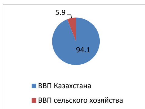
Рисунок 1, Доля сельскохозяйственной отрасли в ВВП Монголии и Республики Казахстан, %

Чтобы оценить, насколько развито сельскохозяйственная отрасль страны с учетом данных для нее условий в смысле интенсивности развития, необходимо сравнить доля сельскохозяйственной отрасли в ВВП Монголии и Казахстана, представленной рисунке 1.